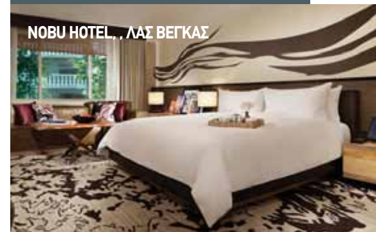
NOBU HOTEL, ΛΑΣ ΒΕΓΚΑΣ