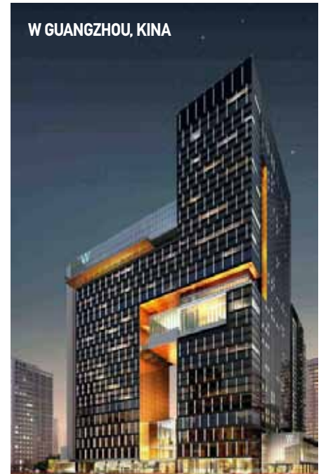
W GUANGZHOU, ΚΙΝΑ

Πριν λίγες ημέρες, στην επιχειρηματική ανατολική όχθη του ποταμού Huangpu της Σαγκάης, άρχισε να λειτουργεί το νέο Mandarin Oriental, που συνδυάζει την ατμόσφαιρα της Ασίας με όλες τις σύγχρονες τάσεις της αρχιτεκτονικής και διακόσμησης. Τα 362 δωμάτια και σουίτες του, έχουν σχεδιαστεί με έμπνευση το παγώνι. Δεκατρείς από τις σουίτες προσφέρουν σάουνα και υδρομασάζ. Έξι εστιατόρια και μπαρ, μεταξύ των οποίων το Qi Bar, με μεγάλους πολυελαίους, μαρμάρινα δάπεδα και βελούδιους καναπέδες, προσφέρονται για ώρες χαλάρωσης, ενώ το κατάστημα Mandarin, προσφέρει τα περίφημα κέικ και τρούφες με την υπογραφή MO.