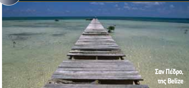
Σαν Πέδρο, της Belize

Το Σαν Πέδρο, της Belize, ένα νησί που είναι διάσημο, όχι μόνο για τις παραλίες του, αλλά για τον κοραλλιογενή ύφαλο - τον δεύτερο σε μέγεθος στον κόσμο - τα ασβεστολιθικά σπήλαια και τα τροπικά δάση που είναι διάσπαρτα από καταρράκτες, βρέθηκε στην κορυφή του πίνακα των καλύτερων νησιών του κόσμου για δεύτερη συνεχόμενη χρονιά, που διαμορφώνει το TripAdvisor Travelers, με βάση τις κρίσεις των τουριστών.