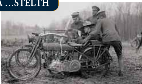
Harley Davidson A ΠΑγκόσμιος Πόλεμος

Σχεδόν έναν αιώνα μετά την πρώτη εμφάνισή της στα πεδία των μαχών, η μοτοσικλέτα, το επονομαζόμενο μηχανοκίνητο ιππικό, γίνεται και πάλι το μεγάλο ζητούμενο από τους στρατιωτικούς που αναζητούν τρόπο αύξησης της επιχειρησιακής ικανότητας των κομάντος, ιδίως σε δυσπρόσιτες περιοχές. Εν προκειμένω για τον αμερικάνικο στρατό και τις δυνάμεις του στο Αφγανιστάν.