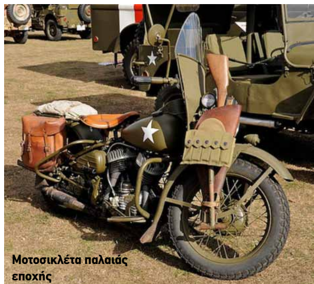
Μοτοσικλέτα παλαιάς εποχής