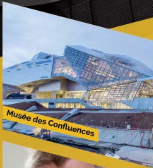
Musée des Confluences