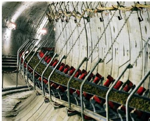
Εικόνα 5. Ταινιόδρομος μεταφοράς αδρανών υλικών μετά την πρωτογενή θραύση εντός υπόγειας στοάς, με δυνατότητα κινήσεως επί καμπυλών ακτίνας μέχρι 200 m. Μεταφορική ικανότητα 1200 m 3 /h (H+E Logistic GmbH, Bochum).

Τα ορυχεία οριζοντίων στοών είναι η απλούστερη από τις τρεις μορφές, γιατί το σύστημα αυτό χρησιμοποιείται κυρίως όταν το κοιτάσμα είναι κοντά στην επιφάνεια, ή ακόμη και όταν εξέχει. Στην τυπική μορφή η στοά είναι οριζόντια και η διαστασιολόγηση των εισόδων προσπελάσεως στο ορυχείο εξαρτάται από την ποσότητα του μεταφερομένου υλικού. Για τη μεταφορά του πετρώματος μπορούν να χρησιμοποιηθούν φορτηγά αυτοκίνητα ή ταινιόδρομοι. Οι τελευταίοι, στην τελευταία εξέλιξη, έχουν την ικανότητα να κινούνται και επί καμπυλών με ακτίνα καμπυλότητας 200 μέτρων (εικόνα 5).