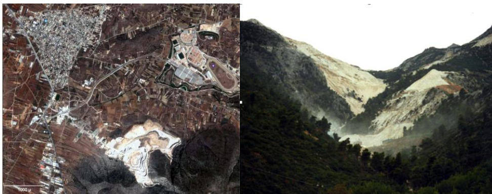
Εικόνα 1. Υπαίθρια λατομεία στην περιοχή της Αττικής