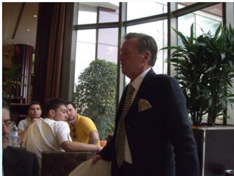
Συνάντηση με τον Έλληνα πρέσβη