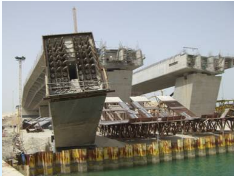
Επίσκεψη στο έργο γεφυροποιίας της ΑΡΧΙΡΟΔΟΝ