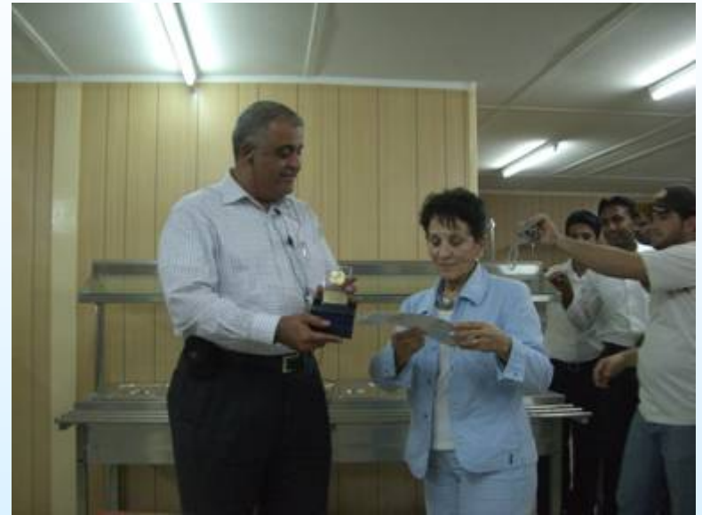
Επίσκεψη σε έργο βιολογικού καθαρισμού της ΑΚΤΩΡ