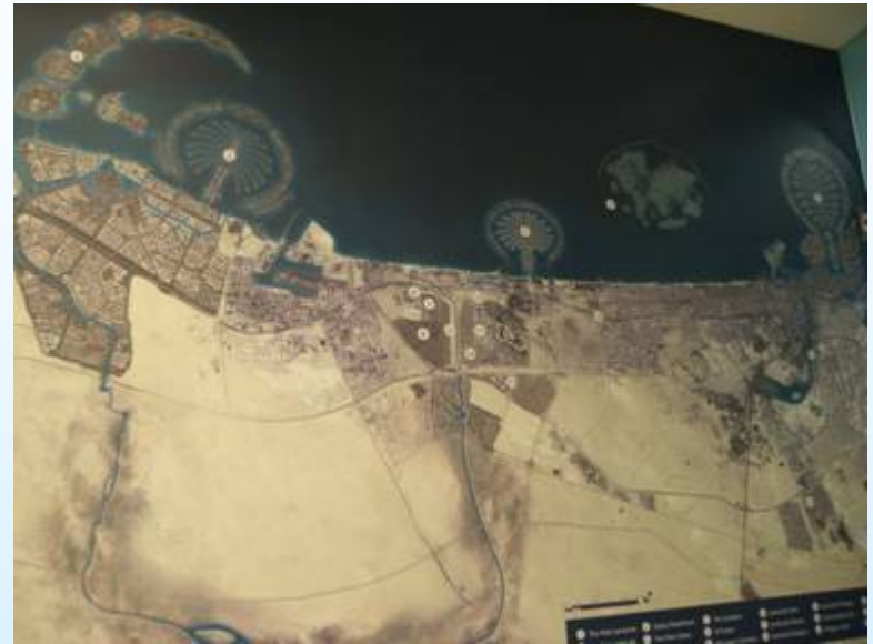
Επίσκεψη στο Palm Jumeirah της ΑΡΧΙΡΟΔΟΝ