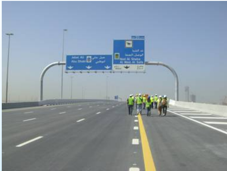
Επίσκεψη σε έργο οδοποιίας της J&P