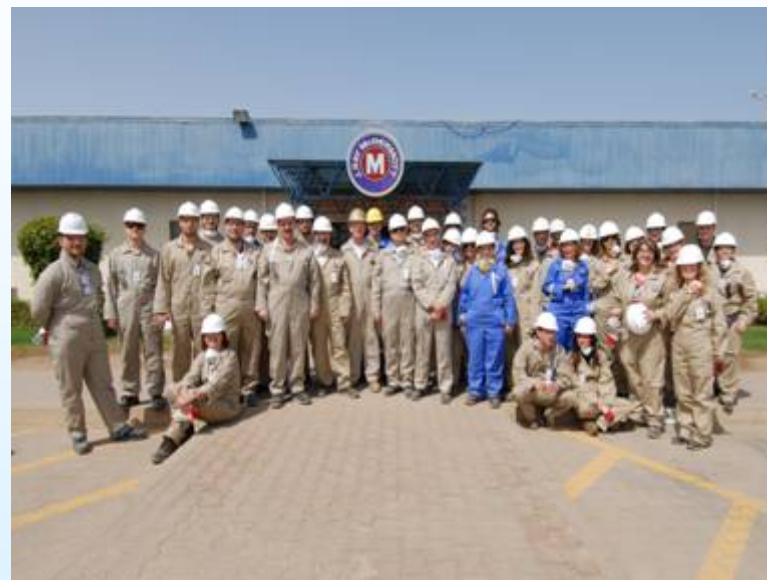
Επίσκεψη στο εργοτάξιο της Mc Dermott