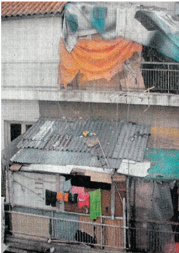
Εικόνα 3: Οδός Ξούθου

Παρά τη διασπορά, οι «ευαίσθητες περιοχές» συναντώνται συχνότερα σε θύλακες χαμηλής εισοδηματικής στάθμης. Ευρέως διαδεδομένος και με ιδιαίτερη σημασία για τη μελέτη του φαινομένου της αστικής βίας είναι και ο κάθετος αποκλεισμός: η συγκέντρωση, δηλαδή, χαμηλόμισθων κοινωνικό-οικονομικών ομάδων στους πρώτους και ημιπόγειους ορόφους πολυκατοικιών και σε διαμερίσματα που βλέπουν σε ακάλυπτους χώρους. Πιο ακραία ακόμα μορφή είναι η ύπαρξη πολυκατοικιών - γκέτο, όπου στοιβάζονται ομάδες στα όρια του περιθωρίου και της νομιμότητας.