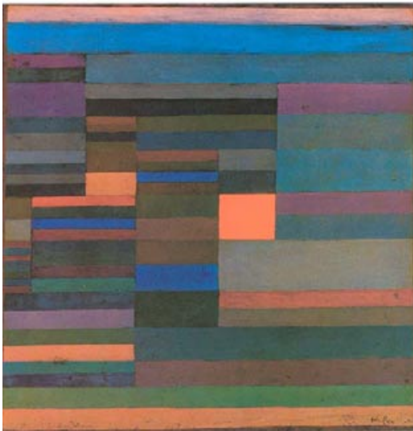
3. Μετρική έκφραση της διαστρωμάτωσης. (Paul Klee)