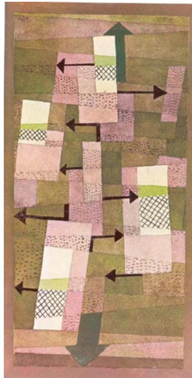
5. Ασταθής ισορροπία. Ακουαρέλα. (Paul Klee)