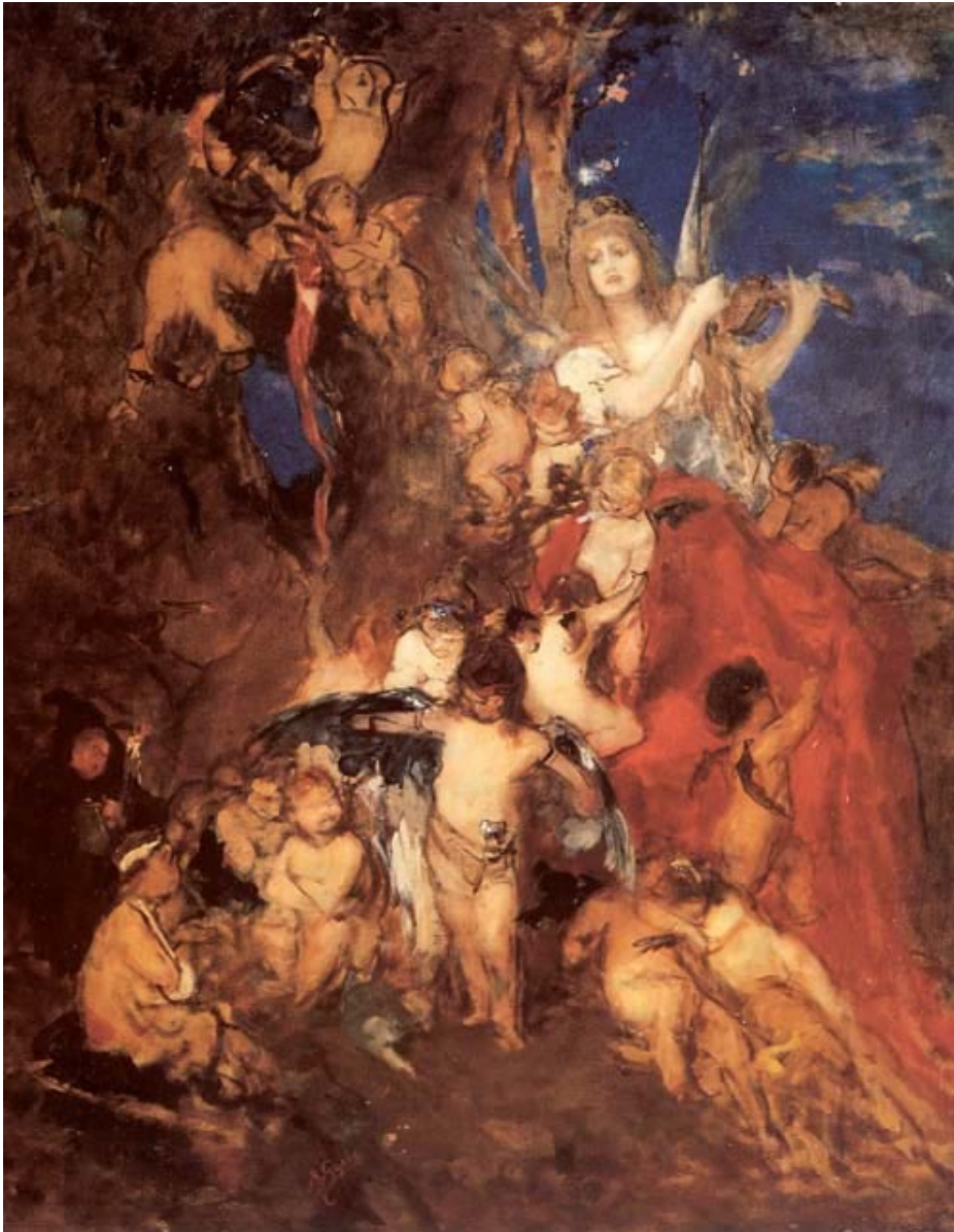
1. Η τέχνη και τα πνεύματά της. (Νικόλαος Γύζης)