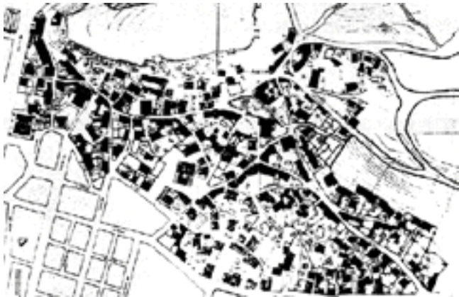
Σχέδιο 3: Φυσική οικιστική δομή και συστηματική επέκταση.

Αναζητείται η «κρίσιμη μάζα», ανθρώπων και λειτουργιών, ώστε η συνεκτική δόμηση να είναι βιώσιμη. Για την έκταση της οικιστικής οργάνωσης προτείνονται τα 160 εκτάρια, ενώ για την πυκνότητα οι προτάσεις διαφοροποιούνται μεταξύ των αστικών και των αγροτικών περιοχών, της ποικιλίας των αντίστοιχων ορισμών. 19 Κύρια διαφοροποίηση της πυκνότητας προκύπτει από την κάθετη ανάπτυξη των λειτουργιών σε χαμηλά ύψη (2-4 όροφοι) με μεγάλη πυκνότητα.