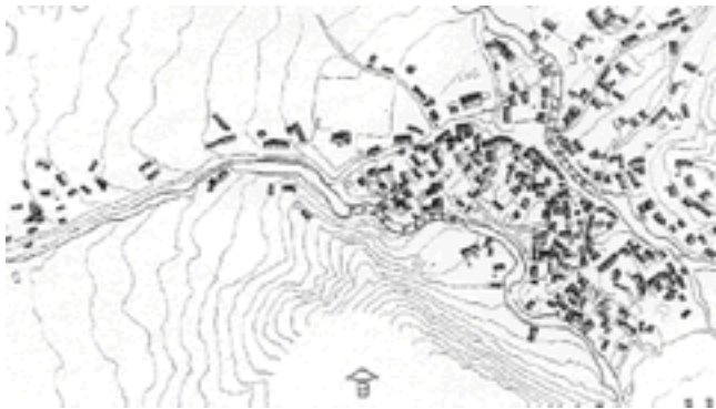
Σχέδιο 1: Παραδοσιακός οικισμός/Φυσική διανομή