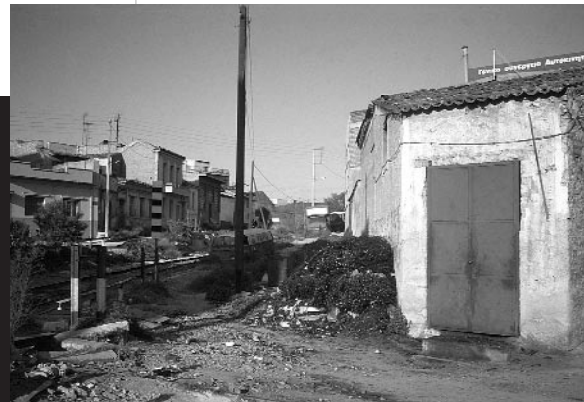
Πειραιάς, 1993