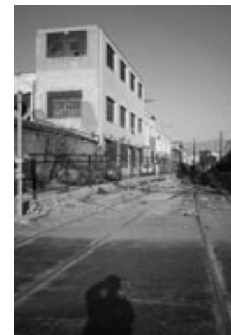
Στο εξώφυλλο: Πειραιάς, 1993