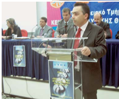
φέρμος , σύμβουλος Παιδαγωγικού

Ινστιτούτου με θέμα «ΕΠΑΛ: Οργάνωση της διαδικασίας της μάθησης».