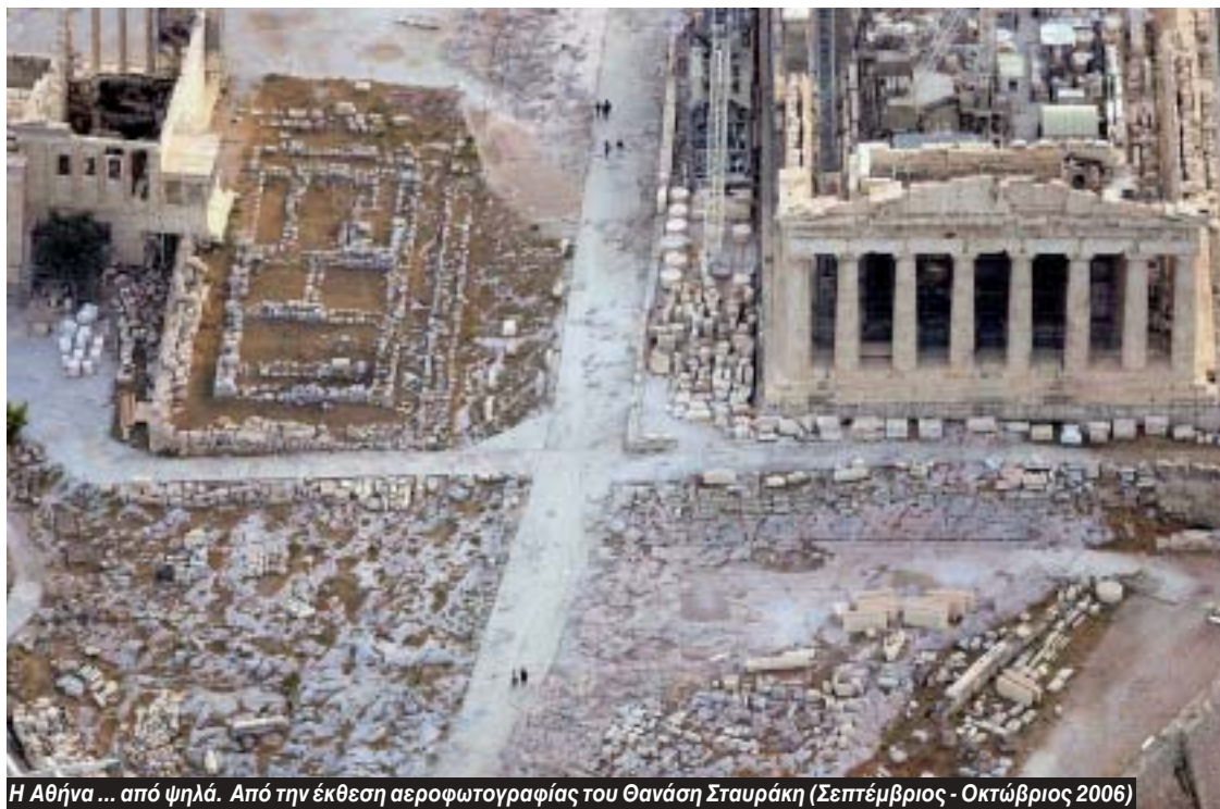
Η Αθήνα ... από ψηλά. Από την έκθεση αεροφωτογραφίας του Θανάση Σταυράκη (Σεπτέμβριος - Οκτώβριος 2006)

Στη χώρα μας, όπου αντιμετωπίζουμε έντονο πρόβλημα υπογεννητικότητας και γήρανσης του πληθυσμού, θα πρέπει να υπάρξουν πολιτικές στήριξης των νέων οικογενειών αλλά και στήριξης των ήδη πολυτέκνων, με οικονομικές και κοινωνικές παροχές. Παράλληλα θα πρέπει να δοθεί έμφαση τόσο στην απασχόληση των νέων όσο και στη δικαίη προσφορά ευκαιριών εργασίας σε όλες τις γενιές.