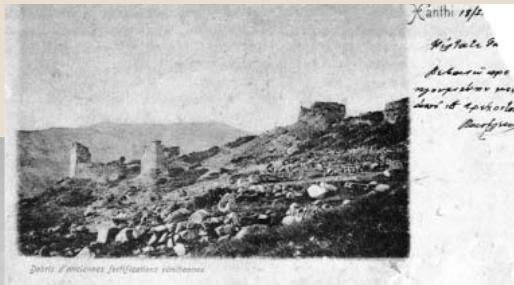
Debris d'anciennes fortifications byzantines

Η δική μας, λοιπόν, στάση δεν είναι μόνον αρνητική, αλλά και εθνικά επιζήμια, ακριβώς επειδή, εκτός από την αντικειμενικότητα στη σκέψη, μάς στερεί και την επιστημονική γνώση, ως εργαλείο υποστήριξης της δικής μας πολιτικής. Μόνο τα τελευταία χρόνια μια πολύ μικρή ομάδα ερευνητών διαφόρων ειδικοτήτων πασχίζει να καλύψει το συγκεκριμένο κενό στην Ελλάδα.