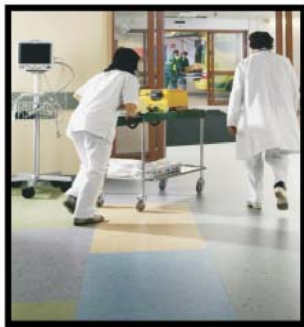
ΝΟΣΟΚΟΜΕΙΑ / PVC