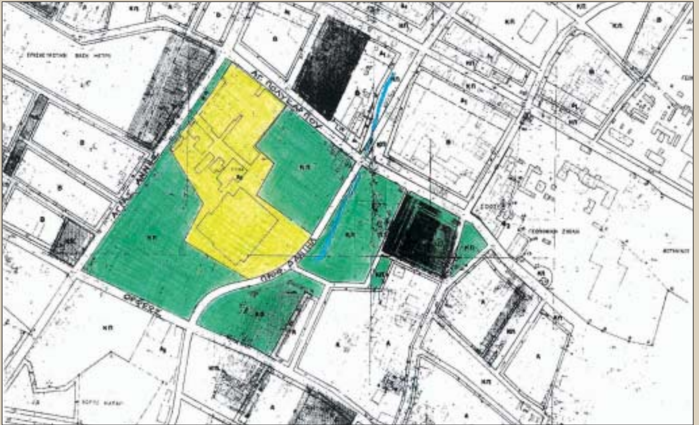
Κατά τη «διπλή ανάπλαση»