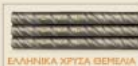
ΕΛΛΗΝΙΚΑ ΧΡΥΣΑ ΘΕΜΕΛΙΑ