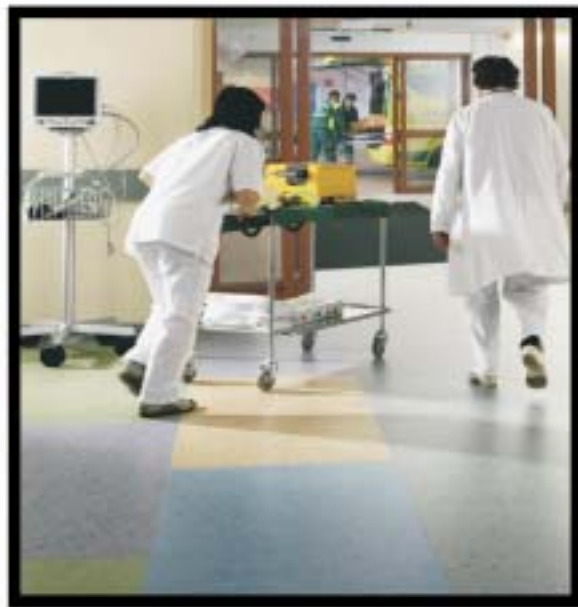
ΝΟΣΟΚΟΜΕΙΑ / PVC