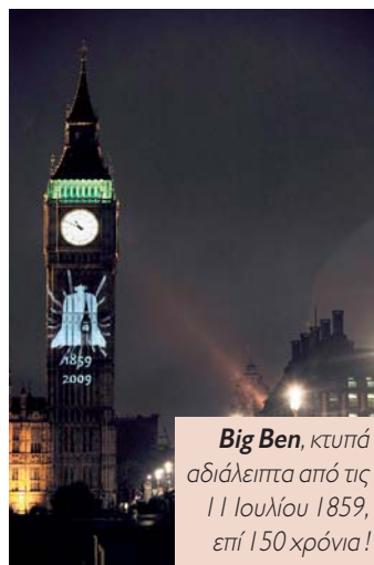
Big Ben , κτυπά αδιάλειπτα από τις 11 Ιουλίου 1859, επί 150 χρόνια!