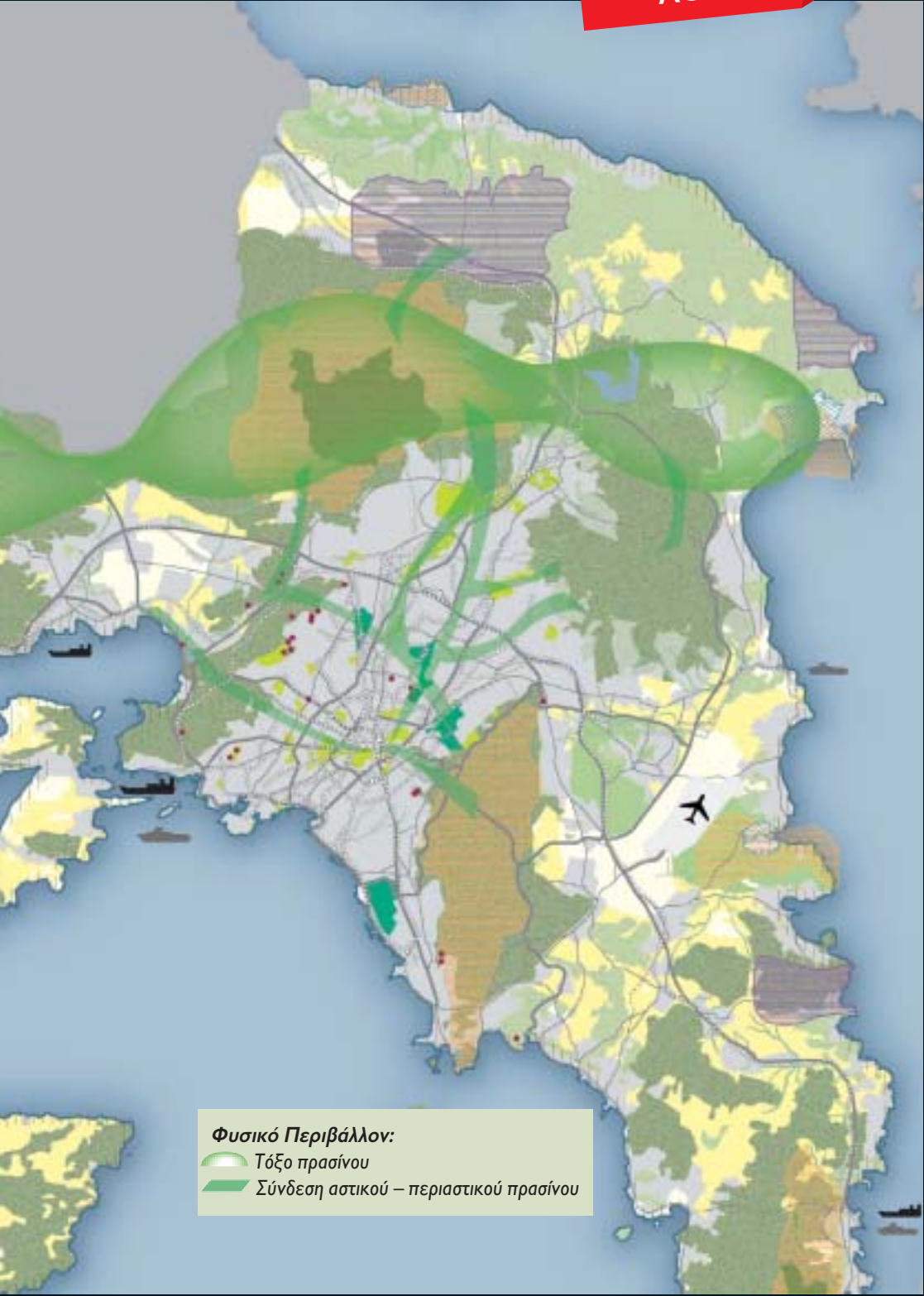
Φυσικό Περιβάλλον: Τόξο πρασίνου Σύνδεση αστικού – περιαστικού πρασίνου