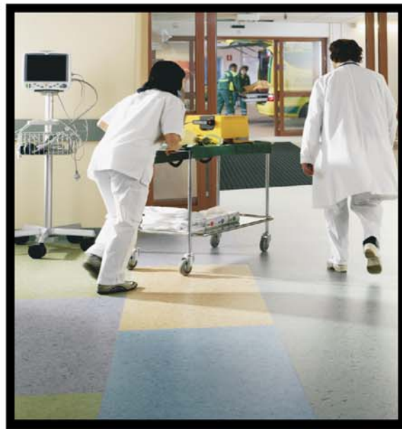
ΝΟΣΟΚΟΜΕΙΑ / PVC