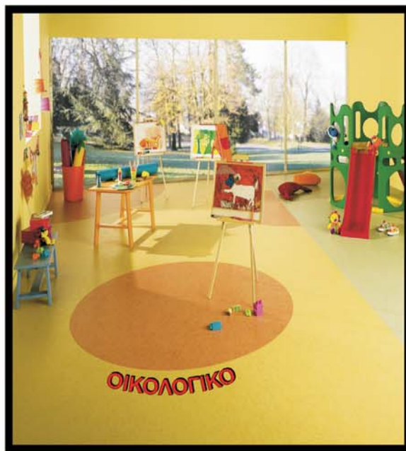
ΣΧΟΛΕΙΑ / Linoleum

Στόχος του ΤΕΕ είναι, μετά και από το Διήμερο, να έχει συγκεντρώσει τις απόψεις ενός πλήθους επιστημόνων, στις οποίες θα βασιστεί για να διαμορφώσει τις δικές του τελικές προτάσεις.