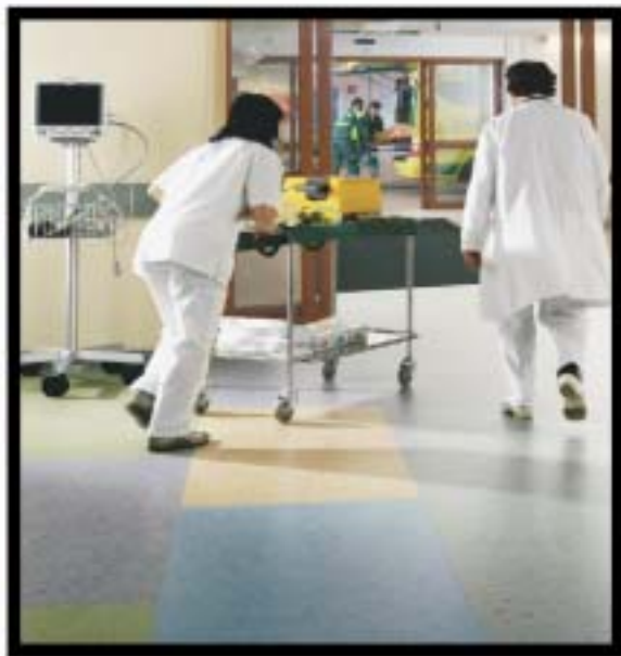
ΝΟΣΟΚΟΜΕΙΑ / PVC