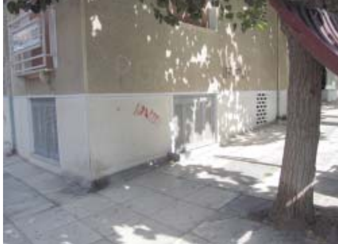
Υπόγεια στο συνεχές σύστημα χωρίς προκήπιο

Π αρατηρούμε με ανησυχία, σε κάθε τροποποίηση του ΓΟΚ, τις τάσεις συνεχών περιορισμών, βύθισης και συσκότισης των υπογείων στα ελληνικά κτίρια (βλ. Ν. 3212/2003 και Ν. 3775/2009 για τους ημιυπαίθριους και τα υπόγεια). Έχει πλέον καταλήξει κουραστική και ανιαρή αυτή η «πιuστ» κεκτημένη συνήθεια συνεχούς μείωσης των επιτρεπομένων, όπως συμβαίνει με τον Ν. 3775/2009, που, με πρόσχημα την τακτοποίηση της αλλαγής χρήσης των υπαρχόντων υπογείων από αποθήκες σε χώρους κυρίας χρήσης, βυθίζει τα νέα υπόγεια ακόμα πιο χαμηλά (στα 0,80 εκατοστά από το περιβάλλον έδαφος, με σχεδόν ολοσχερή κατάργηση ανοιγμάτων), αδιαφορώντας ακόμα και για θέματα πυρασφάλειας (να μπορεί να φτάσει η μάσκα του πυροσβέστη), καθώς επίσης και της ασφαλούς αποχέτευσης.