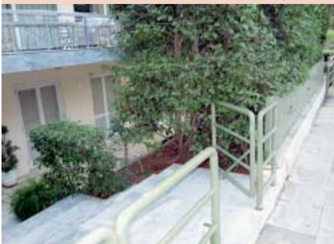
Υπόγεια σε οικόπεδα με προκήπιο