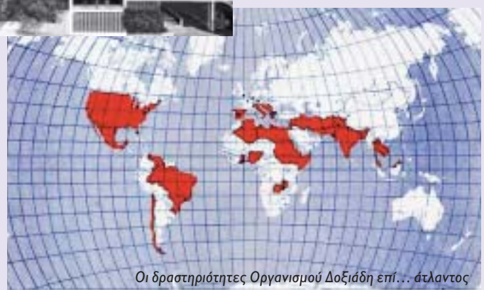
Οι δραστηριότητες Οργανισμού Δοξιάδη επί... άτλαντος

Το 1937 διορίστηκε μηχανικός της Πολεοδομικής Υπηρεσίας της Διοικήσεως Πρωτεύουσας. Από το 1940 έως το 1945 διετέλεσε προϊστάμενος της Πολεοδομικής Υπηρεσίας και προϊστάμενος του Γραφείου Χωροταξικών και Πολεοδομικών Ερευνών και Μελετών (ΓΧΠΜΕ).