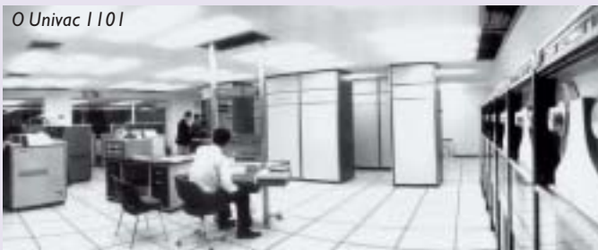
Ο Univac 1101

(Doxiadis Associates), στην οδό Πανεπιστημίου 10, ως ένα κοινό Τεχνικό Γραφείο. Το γραφείο μεγεθύνθηκε και το 1957 μεταστεγάστηκε στο ιδιόκτητο κτίριο επί της Στρατιωτικού Συνδέσμου 24, κάτω από την περιφερειακή οδό του Λυκαβηττού.