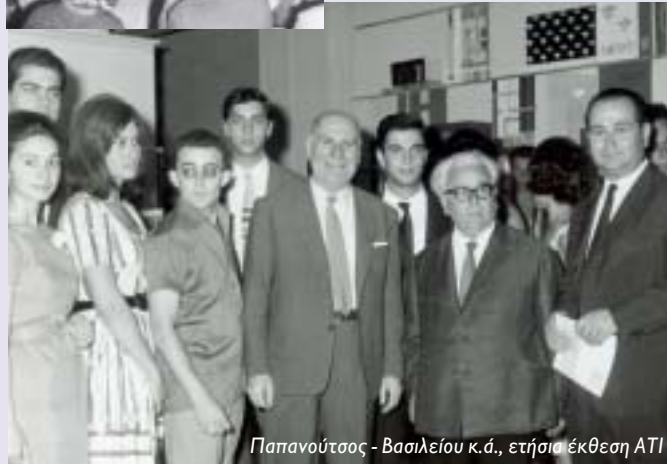
Παπανούτσος - Βασιλείου κ.ά., ετήσια έκθεση ΑΤΙ