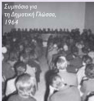
Συμπόσιο για τη Δημοτική Γλώσσα, 1964