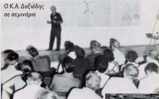
Ο Κ.Α. Δοξιάδης σε σεμινάριο

Ελληνικός Στρατιωτικός Σταυρός για τον πόλεμο 1940-1941 (1941), Παράσημο του Τάγματος της Βρετανικής Αυτοκρατορίας (The Order of the British Empire) για την Εθνική Αντίσταση και τη συνεργασία του με τις Συμμαχικές Δυνάμεις της Μέσης Ανατολής (1945), Παράσημο Τάγματος του Κέδρου του Λιβάνου (The Order of the Cedar of Lebanon) για τις υπηρεσίες αναπτύξεως της χώρας (1958), Σταυρός των Ταξιαρχών του Βασιλικού Τάγματος του Φοίνικος Ελλάδος για τις υπηρεσίες ανάπτυξης της Ελλάδας (1960), «Sir Patrick Abercrombie Award» από τη Διεθνή Ένωση Αρχιτεκτόνων (1963), Χρυσό Μετάλλιο της Ένωσης Μεξικανών Αρχιτεκτόνων, «Cali de Oro» (1963), «Award of Excellence της Industrial Designers Society of America (IDSA)» (1965), «Aspen Award» από το Ινστιτούτο Ανθρωπιστικών Σπουδών Άσπεν (1966), Παράσημο της Γιουγκοσλαβικής Σημαίας με Χρυσό Στεφάνι (1966) και, μετά θάνατον, το 1976, τιμητική απονομή χρυσού μεταλλίου από το «Royal Architectural Institute of Canada».