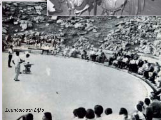
Συμπόσιο στη Δήλο

της Επιτροπής Κατοικίας και Προγραμματισμού του Οικονομικού και Κοινωνικού Συμβουλίου του ΟΗΕ στη Νέα Υόρκη και πρόεδρος της συνεδρίας για τα αστικά προβλήματα στη Διάσκεψη του