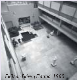
Έκθεση Γιάννη Παππά, 1960

Με τη συνεργασία όλων αυτών και άλλων παραγόντων, το ΑΤΙ οργάνωσε και πραγματοποιήσε καθ' όλη τη διάρκεια λειτουργίας του, πλήθος διαλέξεων, εκθέσεων ζωγραφικής και γλυπτικής, και μουσικών εκδηλώσεων.