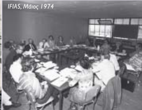
IFIAS, Μάιος 1974

δραστηριότητα την πρώτη στην Ελλάδα Σχολή Τεχνικών Βοηθών/Σχεδιαστών και γενικότερα για την προώθηση της Έρευνας και Εκπαίδευσης, της Τεχνικής Εκπαίδευσης στην Ελλάδα και σε άλλες αναπτυσσόμενες περιοχές, αλλά και εκπαιδευτικών και πολιτιστικών προγραμμάτων.