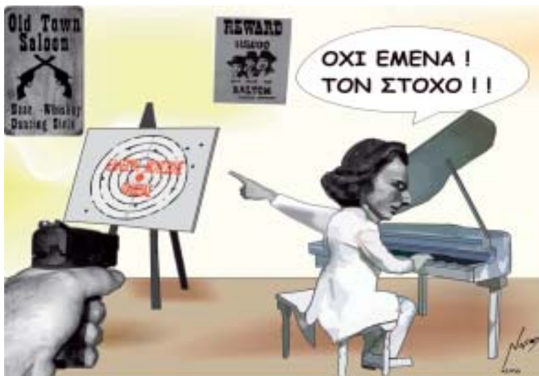
Του Αθανάσιου Ευθυμιάδη

...χημικό που χρησιμοποιείται σε πλαστικά μπουκάλια, δοχεία τροφίμων και κονσέρβες, σχετίζεται με αυξημένο κίνδυνο καρδιοπάθειας, όπως είχαν δείξει προηγούμενες μελέτες και επιβεβαιώνει νέα, η οποία βασίστηκε σε δεδομένα για 1.493 Αμερικανούς ηλικίας 18-74 ετών. Το χημικό αυτό έχει ενοχοποιηθεί για ορμονικές διαταραχές, σεξουαλικά προβλήματα στους άνδρες και εμφάνιση σακχαρώδους διαβήτη. Η χρήση, πλέον, επανεξετάζεται.