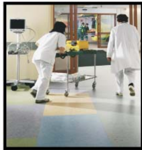
ΝΟΣΟΚΟΜΕΙΑ / PVC