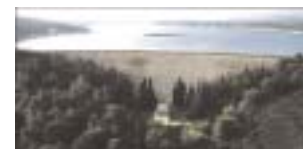
Διάγραμμα 2. Τα σουβλάκια ενός έτους μάς «κοστίζουν» νερό ισοδύναμο με 21 «φράγματα Μαραθώνα»

6. Η εφαρμογή του ΥΑ στη διαχείριση των υδατικών πόρων (ΔΥΠ): Στη χώρα μας η ΔΥΠ αποτελεί ένα εξαιρετικά σημαντικό και αντιφατικό θέμα με πολύ σημαντική πολιτική και κοινωνική διάσταση. Το σημερινό πρόβλημα ΔΥΠ δεν είναι τόσο η έλλειψη των υδατικών πόρων, αλλά η κακή διαχείριση και η αναποτελεσματική πολιτική που εφαρμόζεται, ιδιαίτερα στο γεωργικό τομέα.