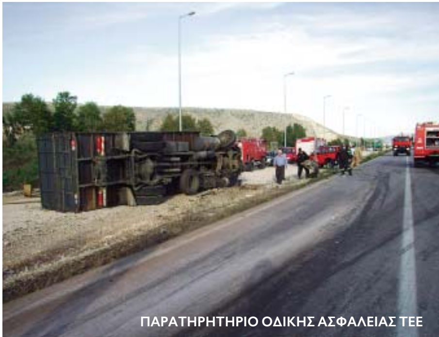
ΠΑΡΑΤΗΡΗΤΗΡΙΟ ΟΔΙΚΗΣ ΑΣΦΑΛΕΙΑΣ ΤΕΕ