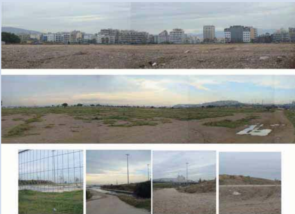
Υπάρχουσα κατάσταση Φαληρικού

Όσον αφορά στην άρδευση του πάρκου, αυτή προβλέπεται να καλυφθεί με την επανάχρηση μέρους των επεξεργασμένων λυμάτων της Ψυττάλειας. Το ΥΠΕΚΑ ετοιμάζει την πρόσκληση για χρηματοδότηση των απαιτούμενων έργων που περιλαμβάνουν την πρόσθετη επεξεργασία των λυμάτων, καθώς και δίκτυο διανομής