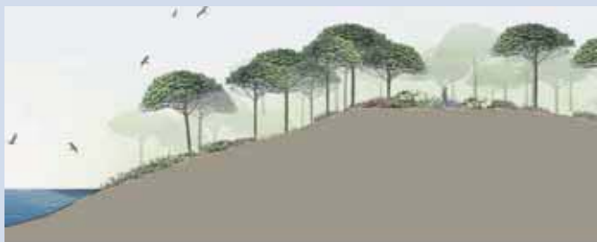
Φύτευση στην περιοχή του Βόρειου Λόφου

πάρκο θα αποτελεί ένα φίλτρο ανάμεσα στην πόλη και τη θάλασσα και ένα δυναμικό φυσικό τοπίο. Η Λεωφόρος Ποσειδώνος μετατοπίζεται προς τη θάλασσα, υποβιβάζεται και καλύπτεται στο μεγαλύτερο μέρος της από το πάρκο. Επιπλέον, προτείνεται η με κάθε τρόπο «διείσδυση» του πάρκου προς τους γειτονικούς δήμους, με φυτεύσεις όλων των πιθανών διαθέσιμων χώρων. Οι δρόμοι εκτείνονται προς τη θάλασσα ως πεζόδρομοι και καταλήγουν σε προκυμαίες. Οι βασικοί από αυτούς