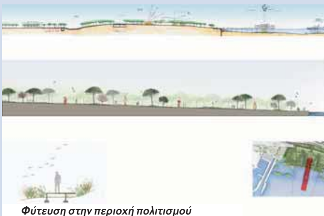
Φύτευση στην περιοχή πολιτισμού

«Ο Renzo Piano ως αρχιτέκτονας, τυγχάνει μεγάλης αναγνώρισης όχι μόνο για το έργο του, αλλά κυρίως για την οικολογική συνείδηση που το διαπνέει» επισημαίνεται στην ίδια ανακοίνωση. «Ασχολήθηκε με αφοσίωση και πάθος, μελέτησε σχολαστικά τα προβλήματα και τις συνθήκες της παρέμβασης και τα αντιμετώπισε σε βάθος και με όραμα».