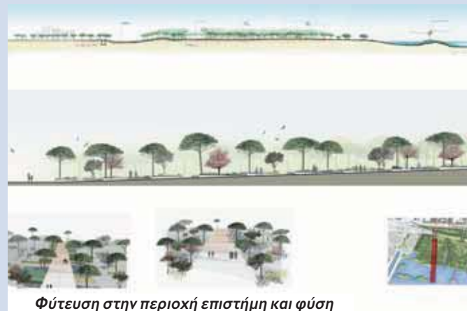
Φύτευση στην περιοχή επιστήμη και φύση