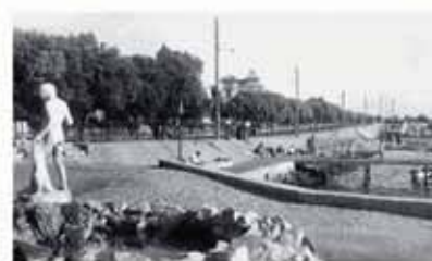
Εικόνες από το παρελθόν...

βλέπεται η προκήρυξη αρχιτεκτονικού διαγωνισμού από το ΥΠΕΚΑ για τη μελέτη της μεγάλης προκουμαίας με την απόληξη του κτιρίου στη θάλασσα, που θα υποδεχτεί εγκαταστάσεις εξυπηρέτησης και αναψυχής.