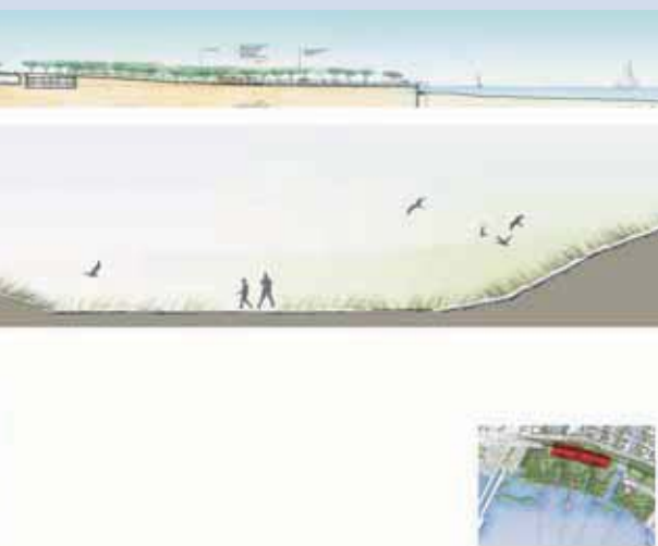
Το αντιπλημμυρικό ανάγλυφο

Το ίδρυμα «Σταύρος Νιάροχος» χορηγεί τις μελέτες που απαιτούνται για την ανάπλαση του Φαληρικού Όρμου, μετά από συμφωνία με το Ελληνικό Δημόσιο. Το κόστος του προγράμματος θα εκτιμηθεί όταν αυτό είναι εφικτό, σε σχέση με την ωριμότητα των μελετών.