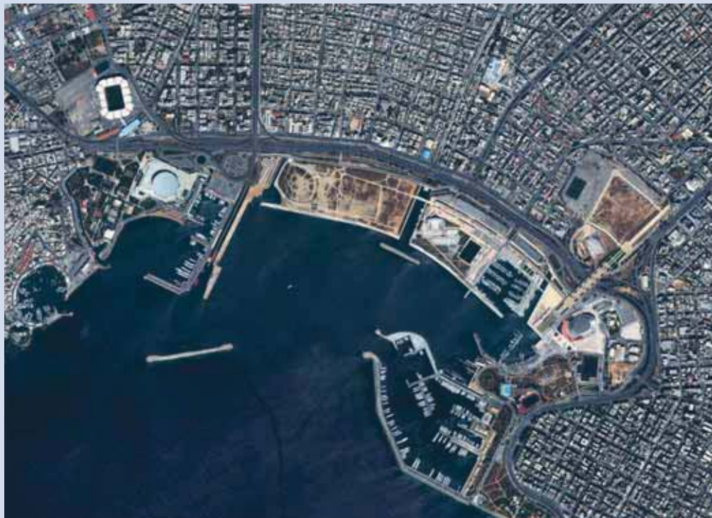
Η περιοχή σήμερα