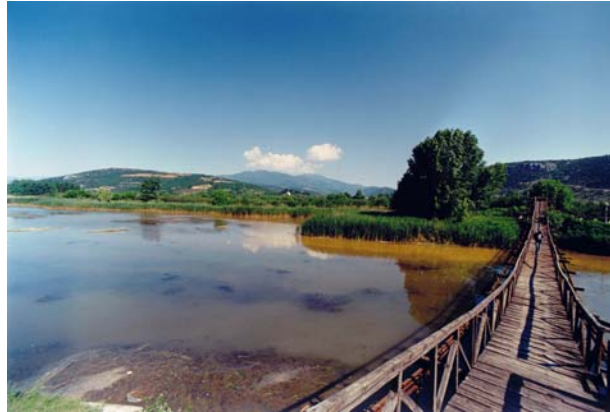
Εικόνα 0: Ο υγροβιότοπος της λίμνης Νησίου του ΥΗΣ Άγρα