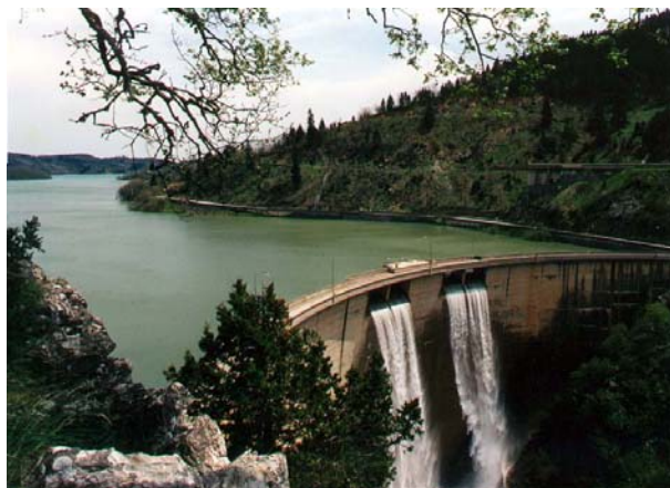
Εικόνα 0: ΥΗΣ Ν. Πλαστήρα