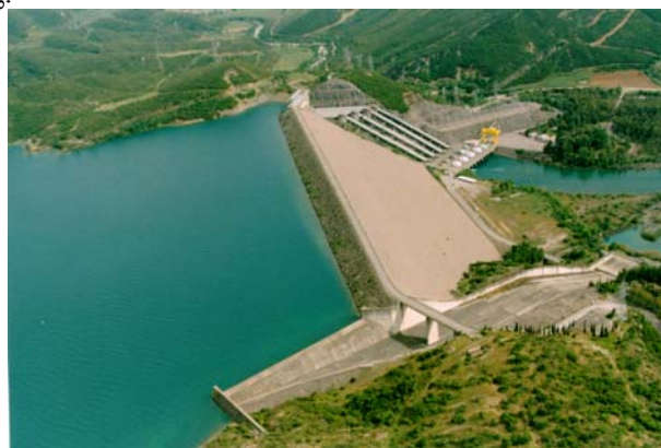
Εικόνα 0: Εβδομαδιαίος τ. ΥΗΣ Καστρακίου στο σύστημα ταμιευτήρων του π. Αχελώου

Ο ετήσιος ταμιευτήρας σε μια αλυσίδα ΥΗΣ ενός ποταμού έχει μεγάλη χωρητικότητα. Η διακύμανση της στάθμης του είναι σημαντική λόγω των μεγάλων ποσοτήτων νερού που αποθηκεύονται. Επίσης, ο ταμιευτήρας αυτός χρησιμεύει για την ανάσχεση των πλημμυρών και την τροποποίηση της διαίτας του ποταμού. Τέτοιοι ταμιευτήρες είναι των Κρεμαστών (Αχελώος), του Πολυφύτου (Αλιάκμονας), του Λάδωνα, του Πουρναρίου Ι, (Αραχθός), των Πηγών Αώου (Αώος), του Ν. Πλαστήρα (Ταυρωπός) και του Θησαυρού (Νέστος).