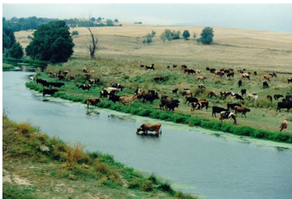
Εικόνα 0: Βοσκή στις όχθες του π. Αλιάκμονα (ταμιευτήρας ΥΗΣ Πολυφύτου)