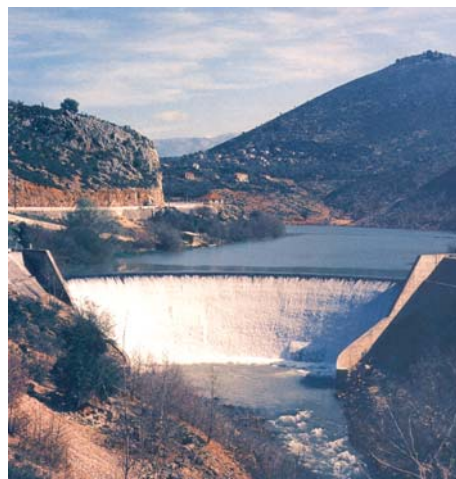
Εικόνα 0: ΥΗΣ Λούρου