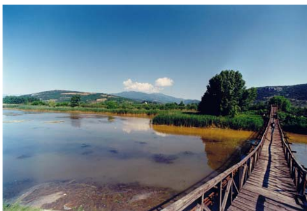
Εικόνα 0: Ο υγροβιότοπος της λίμνης Νησίου του ΥΗΣ Άγρα