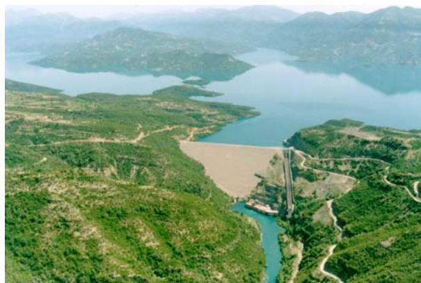
Εικόνα 0: Ετήσιος ταμιευτήρας ΥΗΣ Κρεμαστών στο σύστημα ταμιευτήρων του π. Αχελώου

Η υγρή περίοδος στην Ελλάδα διαρκεί από την αρχή Οκτωβρίου μέχρι το τέλος Μαΐου όταν ολοκληρώνεται το λιώσιμο των αποθεμάτων χιονιού στις ορεινές περιοχές των λεκανών απορροής. Η στρατηγική της ΔΕΗ Α.Ε., όσον αφορά στα αποθέματα νερού στους ταμιευτήρες των ΥΗΣ, είναι να βρίσκονται στο μέγιστο στην αρχή της θερινής (ξηρής) περιόδου ώστε να καλύπτονται οι αυξημένες ανάγκες. Αναφέρεται ενημερωτικά ότι η συνολική ειδική κατανάλωση για την παραγωγή μιας KWH είναι περίπου 2 \text{ m}^3 .