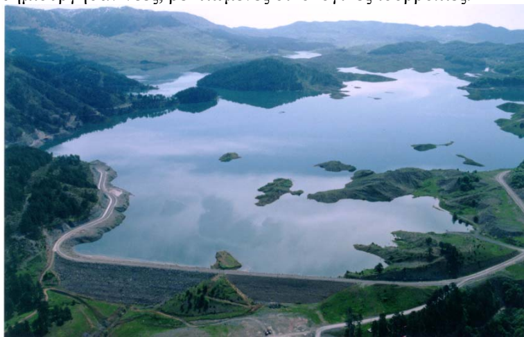
Εικόνα 0: Το φράγμα και ο ταμιευτήρας του ΥΗΣ Π. Αώου

Η συμβολή των μεγάλων Υδροηλεκτρικών Έργων (ΥΗΕ) στην ισόρροπη ανάπτυξη και στην ενεργειακή επάρκεια της χώρας, είναι λίγο πολύ γνωστή σε όλους. Παρά τις επιφυλάξεις που υπάρχουν και πρέπει να υπάρχουν όταν γίνονται σοβαρές παρεμβάσεις στο φυσικό περιβάλλον, δεν αμφισβητείται ότι τα ΥΗΕ -στις περισσότερες των περιπτώσεων- ομόρφυναν τη φύση και δημιούργησαν νέες, βελτιωμένες οικολογικές ισορροπίες.