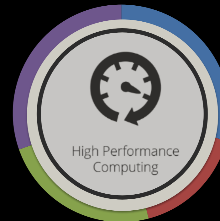
HIGH PERFORMANCE COMPUTING