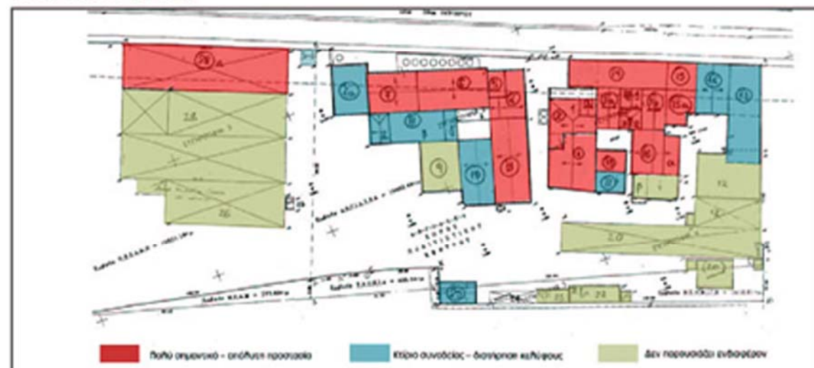
Τοπογραφικό διάγραμμα στο οποίο παρουσιάζονται τα συμπεράσματα και οι προτάσεις της ομάδας εργασίας, για την προστασία του βιομηχανικού συγκροτήματος Φιξ.

Για το σκοπό αυτό προτείνεται να ανοίξει άμεσα ένας διάλογος ανάμεσα στους αρμόδιους φορείς της πόλης, ώστε να προκύψουν άμεσα λύσεις στο πρόβλημα.