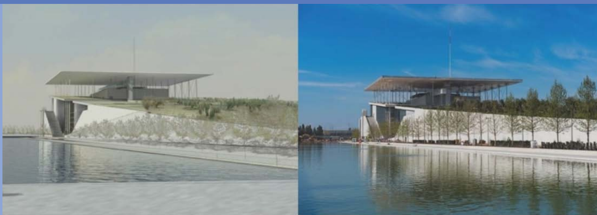
Η φωτορεαλιστική και η πραγματική εικόνα του Κέντρου