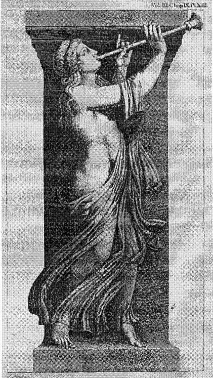
Μαινάδα, τμήμα ανάγλυφης παράστασης από την "Στόα των ειδώλων στην Αρχαία Αγορά της Θεσσαλονίκης". Ανάγλυφα και αρχιτεκτονικά μέλη της αποσπάστηκαν το 1865, και εκτίθενται σήμερα στο μουσείο του Λούβρου.

Πάντα μου έρχεται στη σκέψη η ρήση του νομπελίστα Γιόζεφ Μπρόντσκι "κάθε νέα αισθητική πραγματικότητα βοηθάει τον άνθρωπο να καθορίσει την δική του ηθική πραγματικότητα. Διότι η αισθητική είναι η μητέρα της ηθικής". ■