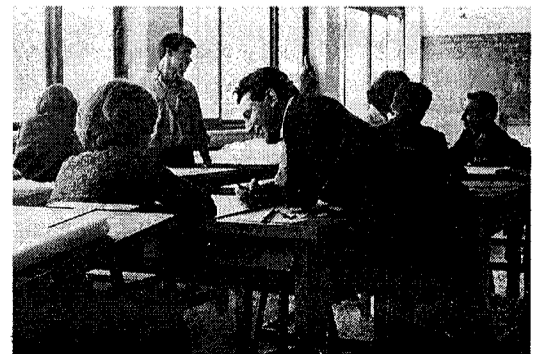
1960: Η σχεδίαση των αποτυπώσεων της Καστοριάς, στην πολυτεχνική σχολή που μόλις πρωτολειτούργησε.