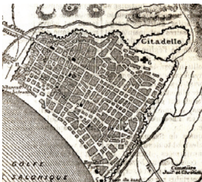
Χάρτες 4: Χάρτης της Θεσσαλονίκης εντός των τειχών από την έκδοση Orient Grece et Turquie d'Europe, 1873 του γαλλικού εκδοτικού οίκου Hachette, όπου φαίνεται κατεδαφισμένο το παραθαλάσσιο τείχος.