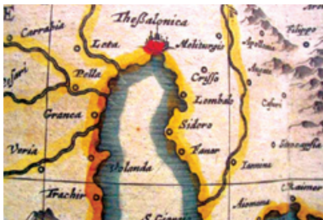
Χάρτες 2: Απεικόνιση της Θεσσαλονίκης σε χάρτη του Ολλανδού χαρτογράφου Joan Blaeu, Atlas Graecia, 1640.

Η έκθεση πραγματοποιήθηκε από 12 Νοεμβρίου 2008 μέχρι 31 Δεκεμβρίου 2008 στο Κέντρο Πολιτισμού του Δήμου Θεσσαλονίκης στην παλιά Αλάνα της Τούμπας. ■