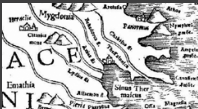
Χάρτες 1: Λεπτομέρεια πολεμιαίκού χάρτη, όπου η Θεσσαλονίκη αναγράφεται ως Thessalonica [Tabula Europa X, Geographia, έκδοση Basle από S. Münster και A. Petri, 1540].

γάλο πρόβλημα των προσφύγων, τα συμφέροντα και οι συνεχείς παρεμβάσεις για λόγους πολιτικής και μικροπολιτικής σκοπιμότητας οδήγησαν σε μεγάλο αριθμό τροποποιήσεων κατά τα επόμενα χρόνια. Οι τροποποιήσεις αυτές ήταν τόσες, ώστε λίγα χαρακτηριστικά του αρχικού σχεδίου να έχουν τελικά διατηρηθεί. Παρόλα αυτά, είναι αδιαμφισβήτητο γεγονός ότι η Θεσσαλονίκη πέρασε στην επόμενη φάση της πολεοδομικής της ιστορίας και ευρύτερης ανάπτυξης. Φαίνεται το τέλος μιας εποχής: οι στενοί δρόμοι και τα σοκάκια αντικαθίστανται με μεγάλα οικοδομικά τετράγωνα και δρόμους με μεγάλο σχετικά πλάτος. Η οθωμανική πόλη αρχίζει να προσπαθεί να μεταλλαχθεί σε ευρωπαϊκή.