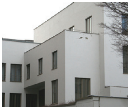
Η οικία Βιτγκενστάιν, έργο του Λούντβιχ Βιτγκενστάιν σε συνεργασία με τον αρχιτέκτονα Paul Engelmann.