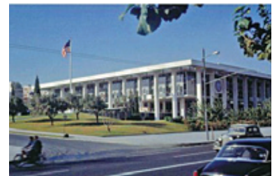
Η αμερικανική πρεσβεία στην Αθήνα ( http://images.google.gr )