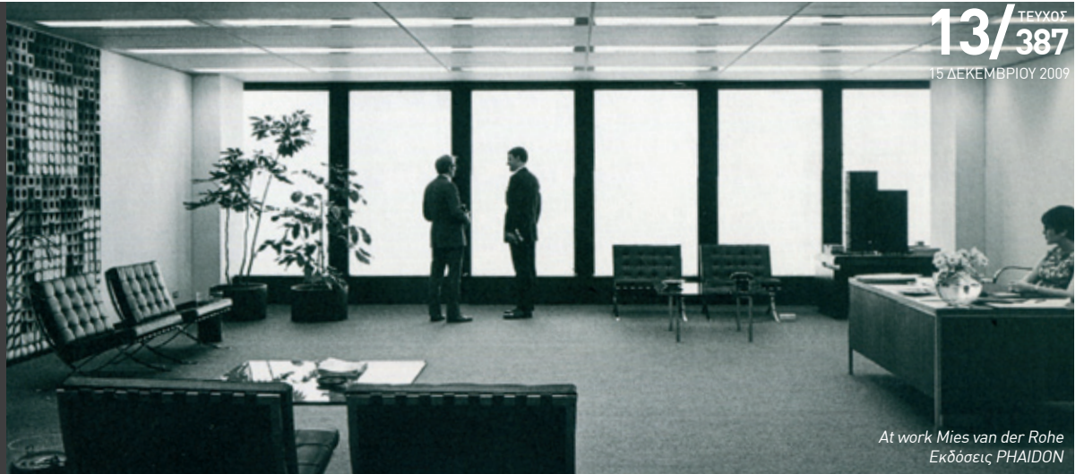
At work Mies van der Rohe Εκδόσεις PHAIDON

υποστηρικτές τους, ωστόσο σε αυτή την περίοδο δεν σημειώνεται κανένα υλοποιημένο πρόγραμμα ή έργο από τη σχολή. Σε ότι αφορά την αρχιτεκτονική παραγωγή, η άποψη πως η σχολή Μπάουχαους ευθύνεται για ένα εκτενές έργο κατασκευής πολλών κατοικιών δεν είναι ακριβής. Ωστόσο, οι σύγχρονοι του Μπάουχαους αρχιτέκτονες (Bruno Taut, Hans Roelzig, Ernst May), των πόλεων του Βερολίνου, της Δρέσδης και της Φρανκφούρτης αντίστοιχα, είναι υπεύθυνοι για πλήθος πρωτοποριακών κατοικιών που χτίστηκαν την περίοδο εκείνη στη Γερμανία, επηρεασμένοι ασφαλώς και από την φιλοσοφία της σχολής Μπάουχαους.