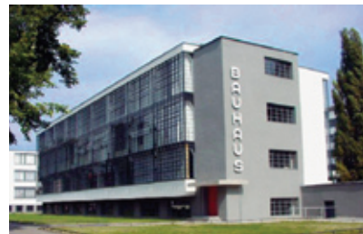
Η σχολή Bauhaus το 1923, ( http://el.wikipedia.org )