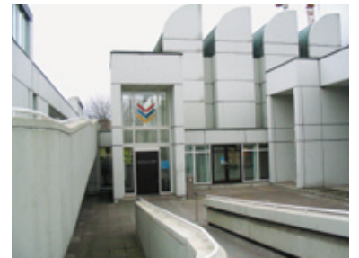
Άποψη του κτιρίου του Αρχείου Μπάουχαους στο Βερολίνο, ( http://el.wikipedia.org )