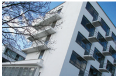
Κτίριο Bauhaus στο Ντεσάου ( www.derkleinegarten.de )