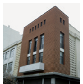
Το κτίριο της Εθνικής Τράπεζας στην πλατεία Δημοκρατίας στη Θεσσαλονίκη