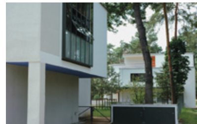
Άποψη των κατοικιών των δασκάλων της σχολής του Ντεσάου