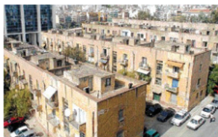
Οι προσφυγικές πολυκατοικίες της οδού Αλεξάνδρας στην Αθήνα