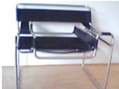
Η καρέκλα Wassily, ένα από τα διασημότερα αντικείμενα που σχεδίασε ο Μαρσέλ Μπρόιερ. ( http://el.wikipedia.org )