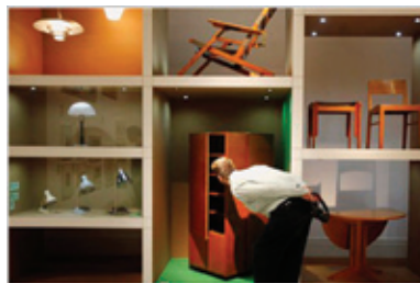
Έκθεση αντικειμένων Μπάουχαους ( www.dw-world.com )