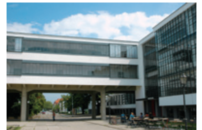
Είσοδος του κτιρίου Bauhaus στο Ντεσάου