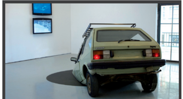
ΕΚΘΕΣΗ «Θεσσαλονίκη: Ίδιος Τόπος-Άλλοι Καιροί», 10 Φεβρουαρίου – 24 Μαρτίου 2010, Κρατικό Μουσείο Σύγχρονης Τέχνης σε συνεργασία με το Πολιτιστικό Κέντρο Θέρμης στο πλαίσιο της 2ης Μπιενάλε Σύγχρονης Τέχνης Θεσσαλονίκης, αίθουσα περιοδικών εκθέσεων του NOESIS-Κέντρο Διάδοσης Επιστημών και Μουσείο Τεχνολογίας, Θεσσαλονίκη.