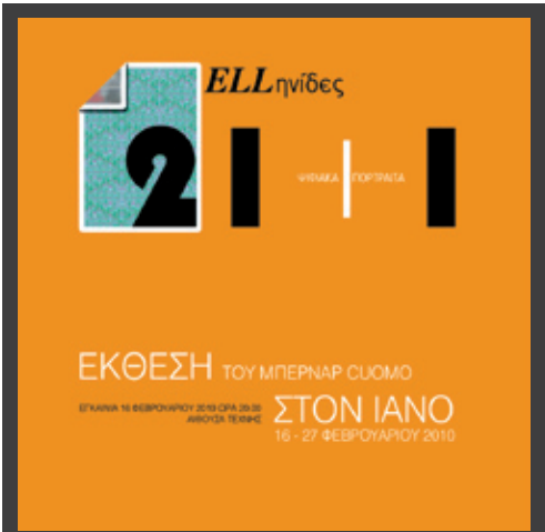
ΕΚΘΕΣΗ του Bernard Cusom, με τίτλο «ELLηνίδες ΨΗ-ΦΙΔΑΚΑ ΠΟΡΤΑΙΤΑ», 16 - 27 Φεβρουαρίου 2010, Gallery IANOS (Αριστοτέλους 7), Θεσσαλονίκη.