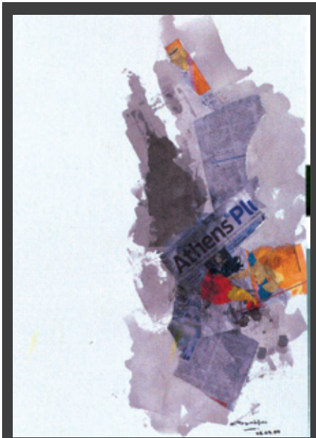
ΕΚΘΕΣΗ ζωγραφικής, γλυπτικής, φωτογραφίας του αρχιτέκτονα Αλέξανδρου Τομπάζη. 20 Φεβρουαρίου – 13 Μαρτίου 2010, αίθουσα τέχνης ΖΗΤΑ-ΜΙ (Πρ. Κορομηλά 1), Θεσσαλονίκη.