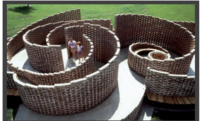
ΑΝΑΔΡΟΜΙΚΗ ΕΚΘΕΣΗ της Αθηνά Τάχα – διακεκριμένης καλλιτέχνιδος στην Αμερική – με τίτλο «Αθηνά Τάχα. Από το Δημόσιο στο Ιδιωτικό», 16 Ιανουαρίου – 11 Απριλίου 2010, ΚΣΤΘ ΚΣΤΘ (Αποθήκη Β1, Λιμάνι), Θεσσαλονίκη.

ΠΡΟΒΟΛΕΣ βραβευμένων ταινιών του 11ου Διεθνούς Πανοράματος Ανεξάρτητων Δημιουργών του Κινηματογραφικού Φεστιβάλ Πάτρας, συνοδευόμενες από την έκθεση φωτογραφίας Πατριών δημιουργών «Φωτογραφίζοντας... σαν σινεμά», 19 – 21 Φεβρουαρίου 2010, contACT (Contemporary Art Club) Δάφνης 12-Γαντισίων (περιοχή City Gate), Θεσσαλονίκη.