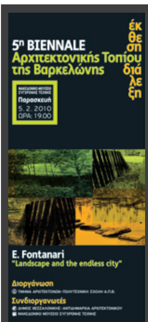
ΕΚΘΕΣΗ φοιτητικών εργασιών της Biennale Αρχιτεκτονικής Τοπίου της Βαρκελώνης 2008, από 5 Φεβρουαρίου 2010, Τμήμα Αρχιτεκτόνων του ΑΠΘ και Δήμος Θεσσαλονίκης-Αντιδημαρχία Αρχιτεκτονικού, Μακεδονικό Μουσείο Σύγχρονης Τέχνης, Θεσσαλονίκη.

ΠΑΡΟΥΣΙΑΣΗ ΛΕΥΚΟΜΑΤΟΣ «Νέο κτήριο της Τράπεζας της Ελλάδος στη Θεσσαλονίκη», 23 Φεβρουαρίου 2010 (ώρα 20.00), IANOS σε συνεργασία με την Τράπεζα της Ελλάδος και το Τεχνικό Επιμελητήριο Ελλάδας-Τμήμα Κεντρικής Μακεδονίας, IANOS (Αριστοτέλους 7), Θεσσαλονίκη.