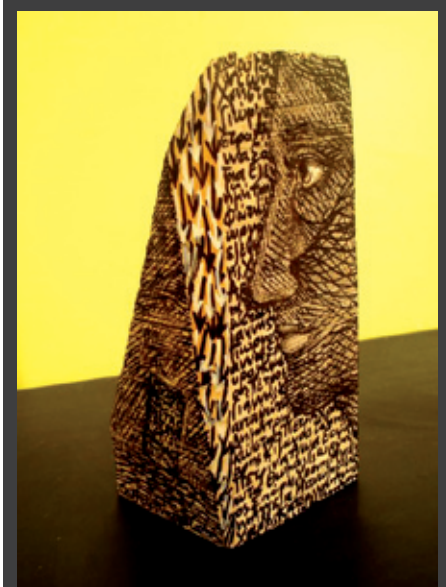
ΕΚΘΕΣΗ ζωγραφικής και γλυπτικών επιζωγραφισμένων κατασκευών του Κώστα Ευαγγελίτου, με τίτλο «Συνθέσεις και φόρμες», 22 Ιανουαρίου – 14 Φεβρουαρίου 2010, Λουτρά «Παράδεισος» (Εγνατία και Γενναδίου), Θεσσαλονίκη.