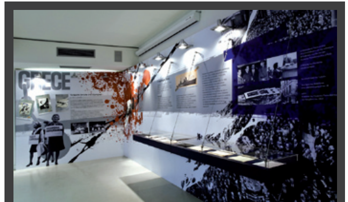
ΕΚΘΕΣΗ ΝΤΟΚΟΥΜΕΝΤΩΝ με τίτλο «Δικτατορία 1967-1974, η έντυπη αντίσταση», 17 Νοεμβρίου 2009 – Φεβρουάριος 2010, Μορφωτικό Ίδρυμα της Ένωσης Συντακτών Ημερησίων Εφημερίδων Μακεδονίας – Θράκης, αίθουσα Ιδρύματος (Μορκενταίου 1), Θεσσαλονίκη.