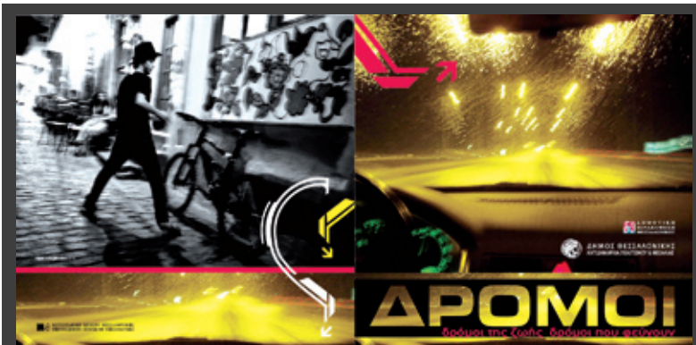
ΟΜΑΔΙΚΗ ΕΚΘΕΣΗ φωτογραφίας και λογοτεχνικών κειμένων, 18 φωτογράφων, 30 λογοτεχνών και 8 ηθοποιών, με τίτλο «Δρόμοι: Δρόμοι της ζωής – Δρόμοι που φεύγουν», 8 – 28 Φεβρουαρίου 2010, μια παραγωγή του Φωτογραφικού Κέντρου Θεσσαλονίκης με την υποστήριξη της Αντιδημαρχίας Πολιτισμού και Νεολαίας του Δήμου Θεσσαλονίκης, Παλιό Αρχαιολογικό Μουσείο Θεσσαλονίκης, (Γενί τζαμί), Αρχαιολογικού Μουσείου 30, Θεσσαλονίκη