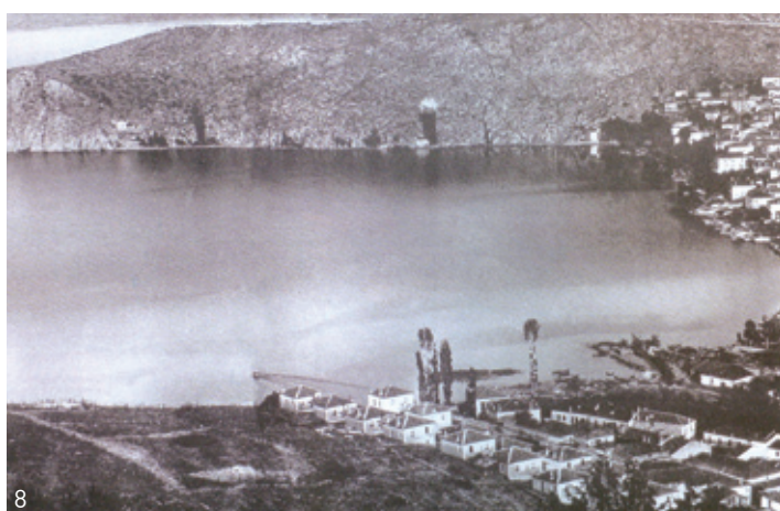
1. Τα σπίτια του προσφυγικού συνοικισμού της Καλλιθέας με φόντο το βουνό της «Μύτης του Μεγαλέξανδρου» 2, 5. Απόψεις συμμετρικής διπλοκατοικίας 3, 4, 7. Κατόψεις και τομές κατοικιών 6. Απόψεις τετράγωνης μονοκατοικίας 8. Σε πρώτο επίπεδο οι δύο σειρές των τετράγωνων μονοκατοικιών του συνοικισμού, που κτίστηκαν σε πρώτη φάση.