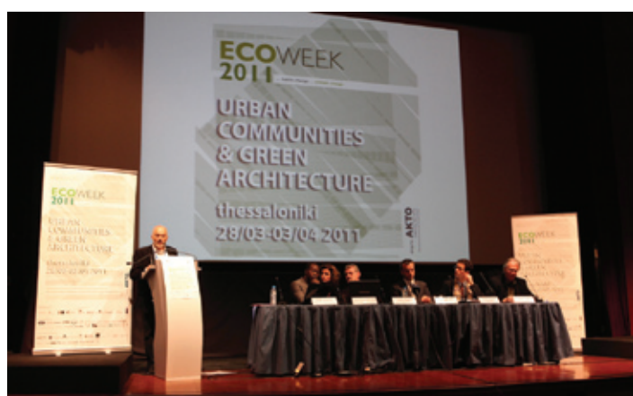
Συνέντευξη τύπου της ECOWEEK 2011 στο Ολύμπιο στη Θεσσαλονίκη.

Με σκοπό να δημιουργήσει μια κοινότητα νέων 'πράσινων' μηχανικών, η ECOWEEK έχει δημιουργήσει το νέο ιστοχώρο για τους 'απόφοιτους' και συμμετέχοντες στα εργαστήρια σχεδιασμού της ECOWEEK όπου προωθείται η συνεργασία, η δικτύωση και η προβολή των νέων επαγγελματιών. Η διεύθυνση είναι www.ecoweek.net Περισσότερες πληροφορίες για τη δραστηριότητα της ECOWEEK στην ιστοσελίδα www.ecoweek.org ■