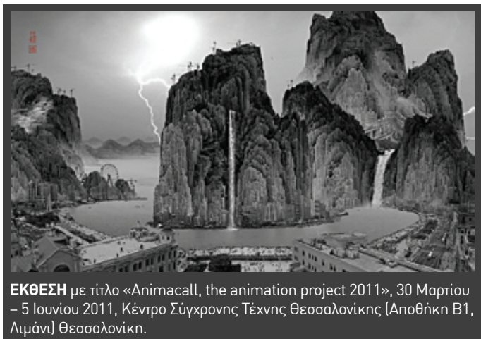
ΕΚΘΕΣΗ με τίτλο «Animacall, the animation project 2011», 30 Μαρτίου - 5 Ιουνίου 2011, Κέντρο Σύγχρονης Τέχνης Θεσσαλονίκης (Αποθήκη Β1, Λιμάνι) Θεσσαλονίκη.

ΟΜΑΔΙΚΗ ΕΚΘΕΣΗ ΖΩΓΡΑΦΙΚΗΣ ομάδας αποφοίτων της σχολής Καλών Τεχνών του ΑΠΘ, με τίτλο «Προς Τέρψη», 7 Μαΐου - 11 Ιουνίου 2011, γκαλερί Tettix (Τσιμισκή - Διαλέτη 3, απέναντι από τη ΧΑΝΘ), Θεσσαλονίκη.