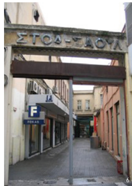
1. Περιοχή Λαχανόκηπων: Τμήμα Αρχιτεκτόνων Π. Θεσσαλίας [Διδάσκοντες: Γιώργος Τριανταφυλλίδης, Δήμητρα Φύγκα, Αλέξης Δάλλας]