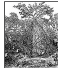
E. Viollet-le-Duc: "Histoire de l'habitation humaine", 1875