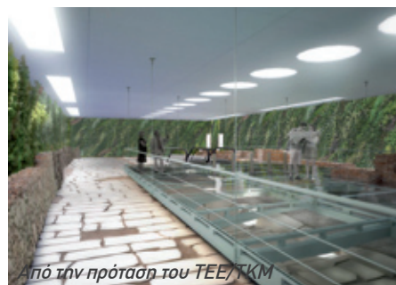
Από την πρόταση του ΤΕΕ/ΤΚΜ

Δείτε την πλήρη πρόταση του ΤΕΕ/ΤΚΜ στο site του Τμήματος www.tkm.tee.gr