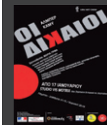
Από τις 17 Ιανουαρίου 2014, 20, έναντι εκκλησίας Αγ. Δημητρίου, Θεσσαλονίκη

ΠΑΡΑΣΤΑΣΗ με τίτλο «Η Παναγία των Παρισίων» του Βίκτωρ Ουγκώ σε παραγωγή του Θεάτρου Αυλαία. Έως το Πάσχα 2014. Θέατρο Αυλαία Πολυχώρος Τέχνης, Κτίριο ΧΑΝΘ, Ταμιακή, Θεσσαλονίκη. Πληρ.: 2310 237700.