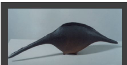
ΕΚΘΕΣΗ ΕΙΚΑΣΤΙΚΗ με έργα των : Βούλα Γουνελά, Βέρα Σιατερλή, Δήμητρα Σιατερλή, Μάγδα Ταμμάμ, Τσαλαματά, Θεοδώρα Χωραφά. Έως 31 Ιανουαρίου 2014, Γκαλερί ΛΟΛΑ ΝΙΚΟΛΑΟΥ, Ταμιακή 52, Θεσσαλονίκη

ΦΩΤΟΓΡΑΦΙΑΣ με τίτλο «ΤΑ ΚΕΝΤΡΙΚΑ ΒΑΛΚΑΝΙΑ ΑΝΑΜΕΣΑ ΣΤΟΝ ΕΛΛΗΝΙΚΟ ΚΑΙ ΤΟΝ ΚΕΛΤΙΚΟ ΚΟΣΜΟ» από τις ανακαφές στην αρχαιολογική θέση Κάλε της Κρσεβίτσα στη νοτιοανατολική Σερβία. Έως