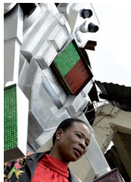
Με τα μακριά ρομποτικά τους χέρια ρυθμίζουν την κίνηση των οχημάτων, ενώ από το στήθος τους ειδοποιούν τους πεζούς πότε είναι η κατάλληλη στιγμή να διαβούν τον δρόμο. Και για τους πεζούς που χαζεύουν ή έχουν προβλήματα όρασης, τα ρομπότ μιλούν κιόλας, λέγοντας πότε είναι ασφαλές να διασχίσουν τον δρόμο!