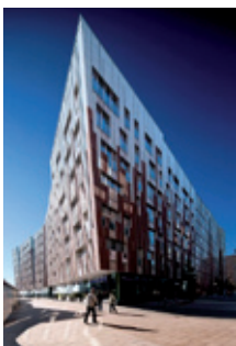
Κτήριο πολυλαπλών χρήσεων στο Überseequarter του Αμβούργου. Αρχιτέκτων: Erick van Egeraat. http://www.archdaily.com/

Το 2001-2002 μπήκε στην αφετηρία. Σήμερα έχει προσελκύσει στο Αμβούργο περίπου 500 επιχειρήσεις και έχει ανοίξει χιλιάδες νέες θέσεις εργασίας. Το 2020 εκτιμάται ότι εντός του HafenCity θα ζουν μόνιμα 12.000 άνθρωποι και θα εργάζονται 45.000, ενώ το πρότζεκτ θα έχει αυξήσει κατά 40% την έκταση του υπάρχοντος κέντρου της πόλης!