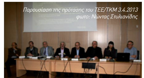
Παρουσίαση της πρότασης του ΤΕΕ/ΤΚΜ 3.4.2013

Για το ΜΕΤΡΟ το ΤΕΕ/ΤΚΜ επαναλαμβάνει το πάγιο αίτημα για προώθηση της ολοκλήρωσης της