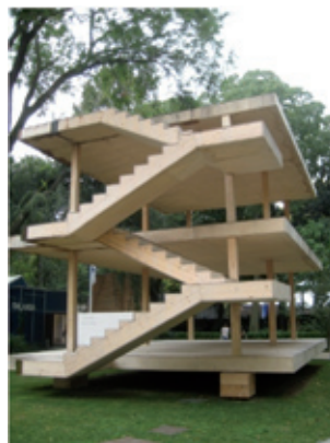
(“La Maison Domino” Le Corbusier σε κλίμακα 1:1, Giardini)

λιξη τους στο χρόνο. Σύμφωνα με την 2χρονη έρευνα φοιτητών του Harvard Graduate School of Design όπου ο Koolhaas διδάσκει, 15 είναι τα βασικά στοιχεία που στοιχειοθετούν διαχρονικά την αρχιτεκτονική κατασκευή: το πάτωμα, ο τοίχος, η σκεπή, το ταβάνι, η πόρτα, το παράθυρο, η όψη, το μπαλκόνι, ο διάδρομος, το τζάκι, η τουαλέτα, η σκάλα, οι κυλιόμενες σκάλες, το ασανσέρ και η ράμπα.