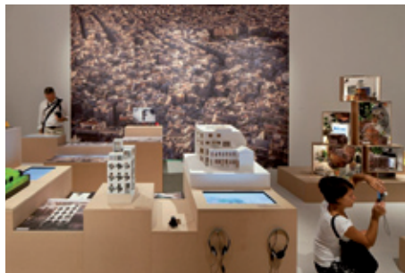
(Greek Pavilion, Giardini)

Στο δεύτερο τμήμα παρουσιάζονται οι σχεδιαστικές προτάσεις 15 Ελλήνων και ξένων αρχιτεκτόνων για μια παραθαλάσσια τουριστική εγκατάσταση, τοποθετημένες στο κέντρο του περιπτέρου σε όμοιες βάσεις, διαφορετικών όμως υψών.