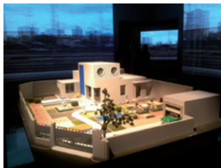
(Villa Arpel, film “Mon Ocle” 1958, French Pavilion)

Έξω από το κεντρικό κτίριο των «Giardini» τοποθετήθηκε αναπαράσταση σε κλίμακα 1:1 του δομικού συστήματος Ντόμινο του Λε Κορμπυζιέ, που παρουσιάστηκε για πρώτη φορά το 1915. Πρόκειται για μονολιθική κατασκευή οπλισμένου σκυροδέματος με τρία κύρια στοιχεία: την πλάκα, την κολόνα και το κλιμακοστάσιο. Για την Αρχιτεκτονική θεωρείται μία από τις σημαντικότερες ιδέες του μοντερνισμού γιατί επιτρέπει την ανεξαρτητοποίηση της όψης και της κάτοψης από την κατασκευή. Από κοινωνικής άποψης θεωρείται επίσης πολύ σημαντικό επειδή πρόσφερε λύσεις στην στέγαση των χαμηλών εισοδηματικών στρωμάτων και την ταχεία ανοικοδόμηση των κτιρίων.