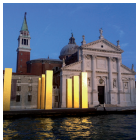
(“the sky over nine columns”, Isola di San Giorgio)

Η έκθεση φωτογραφίας της Ελληνίδας φωτογράφου Λίλης Μανωλά με τίτλο «Ethiopia, Spiritual Imprints» στο μοναστήρι του San Giorgio, στο νησί San Giorgio Maggiore. Πρόκειται για ένα συγκινητικό φωτογραφικό αφήγημα με κεντρικό άξονα την θρησκευτική ζωή στην Αιθιοπία, μία χώρα με έντονη χριστιανική παράδοση ήδη από τον 4ο μ.Χ. αιώνα. Τον Ιούνιο του 2015 η έκθεση θα παρουσιαστεί στο Βυζαντινό και Χριστιανικό Μουσείο στην Αθήνα.