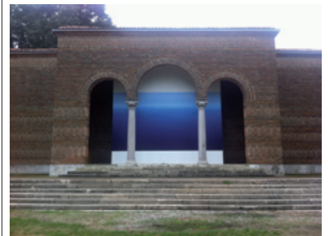
(Greek Pavilion, Giardini)

Η Ελληνική συμμετοχή στη 14 η Μπιενάλε Αρχιτεκτονικής με θέμα «Absorbing Modernity 1914-2014» σχετίζεται με τη συμβολή του τουρισμού στη Μεταπολεμική ανάπτυξη της χώρας και στην προσπάθεια καθιέρωσής της στην παγκόσμια τουριστική βιομηχανία, που υλοποιήθηκε με την κατασκευή τουριστικών ξενοδοχείων, θέρετρων, μουσείων κτλ. καθώς και τη διαμόρφωση οργανωμένων ακτών, τουριστικών τοπίων, αρχαιολογικών και λοιπών δημόσιων