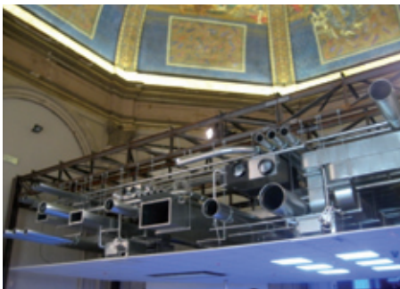
(Τομή ψευδοροφής & μηχανολογικός εξοπλισμός, Κεντρικό κτίριο, Giardini)

Η έκθεση εκτείνεται σε δύο τμήματα, στους καταπράσινους κήπους της περιοχής Giardini και στην ιστορική περιοχή Arsenale, όπου κατασκευάζονταν οι περίφημες γαλέρες του Βενετσιάνικου στόλου καθώς και τα εμπορικά πλοία της θαλασσοκράτειρας.