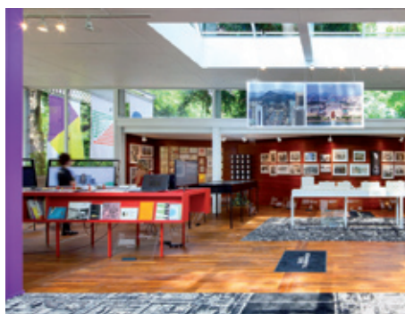
(Korean Pavilion, Arsenale)

Το βραβείο του Χρυσού Λέοντα για την καλύτερη εθνική συμμετοχή κέρδισε η Κορέα για τη συμμετοχή της με τίτλο «Crow's Eye View: The