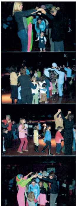
Τα παιδιά παίζει