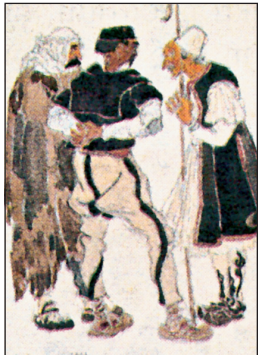
Η Θεσσαλονίκη των ζωγράφων - περιηγητών του 19ου και 20ου αιώνα