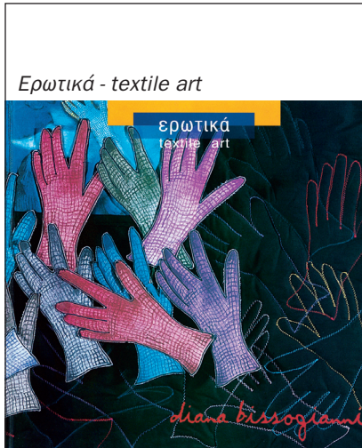
Ερωτικά - textile art