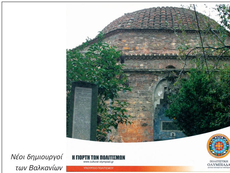
Νέοι δημιουργοί των Βαλκανίων

Η ΓΙΟΡΤΗ ΤΩΝ ΠΟΛΙΤΙΣΜΩΝ www.cultural-olympiad.gr ΥΠΟΥΡΓΕΙΟ ΠΟΛΙΤΙΣΜΟΥ