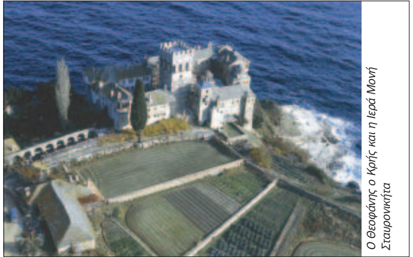
Ο Θεοφάνης ο Κρής και η Ιερά Μονή Σταυρονικήτα

ΕΚΘΕΣΗ και μια site-specific εγκατάσταση τεραστίων διαστάσεων του Γιάννη Κουνέλλη, 14 Ιουλίου – 31 Δεκεμβρίου 2004, Εθνικό Μουσείο Σύγχρονης Τέχνης, Αθήνα.