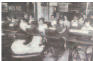
Η εμπορική δραστηριότητα των Εβραίων της Θεσσαλονίκης κατά τη διάρκεια του Μεσοπολέμου