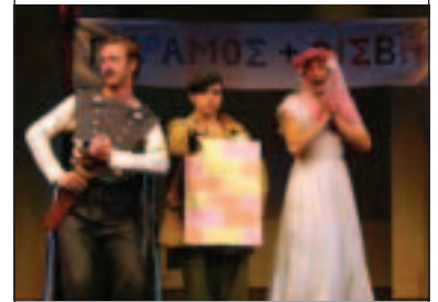
Όνειρο καλοκαιρινής νύχτας